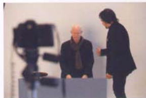
Tony Cragg. Va tancar la sessió del darrer càsting.

Faces Project , el treball multidisciplinari de l'artista Bernardi Roig, ha tingut la participació de 1.870 voluntaris. L'artista cercava la col·laboració de 1.700 persones per a la realització de l'eix central del seu projecte i va superar totes les previsions. Durant quatre dies es va dur a terme a Sa Llonja de Palma una sessió de càsting individualitzada entre tots els voluntaris que han volgut participar-hi. Bernardi Roig va agrair la col·laboració de tots els participants, des de personatges del món de la política fins a persones provinents del món de la cultura, com és el cas de l'escultor i premi Turner de l'any 1998, Tony Cragg, que també va participar en el càsting i va posar davant el fotògraf fent una ganyota. La idea de Bernardi Roig era la de fotografiar cada un dels rostres fent un dels tres gestos que es proposaven gràficament, els qual han estat inspirats en l'obra escultòrica de l'artista barroc Franz Xaver Messerschmidt. El conjunt de les imatges apareixerà reproduït al catàleg de l'exposició, que s'editarà amb motiu de la mostra que es presentarà el pròxim mes de juliol a Sa Llonja i que recollirà el treball realitzat per Bernardi Roig en aquest projecte.