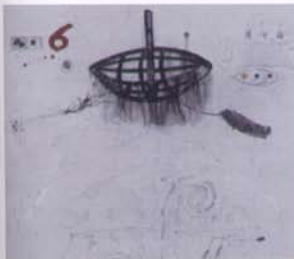
Joanpere Massana. Vaixell d'utopies II.