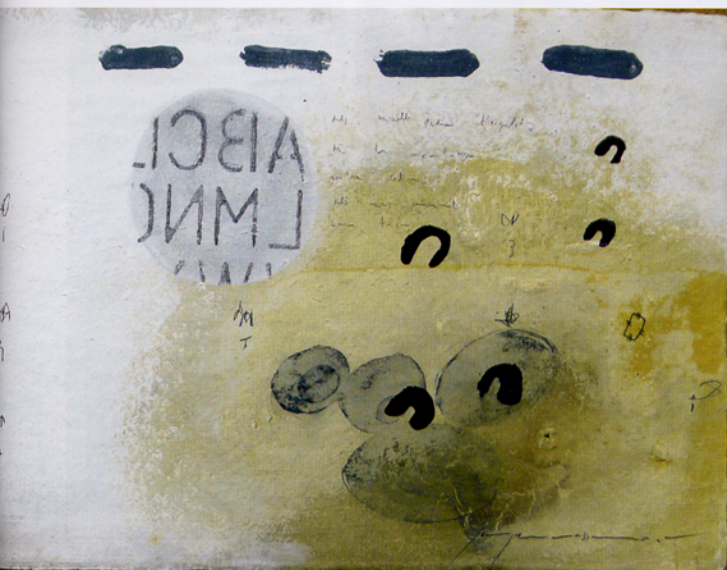
Viatgers de pas. 28,5 x 75 cm.