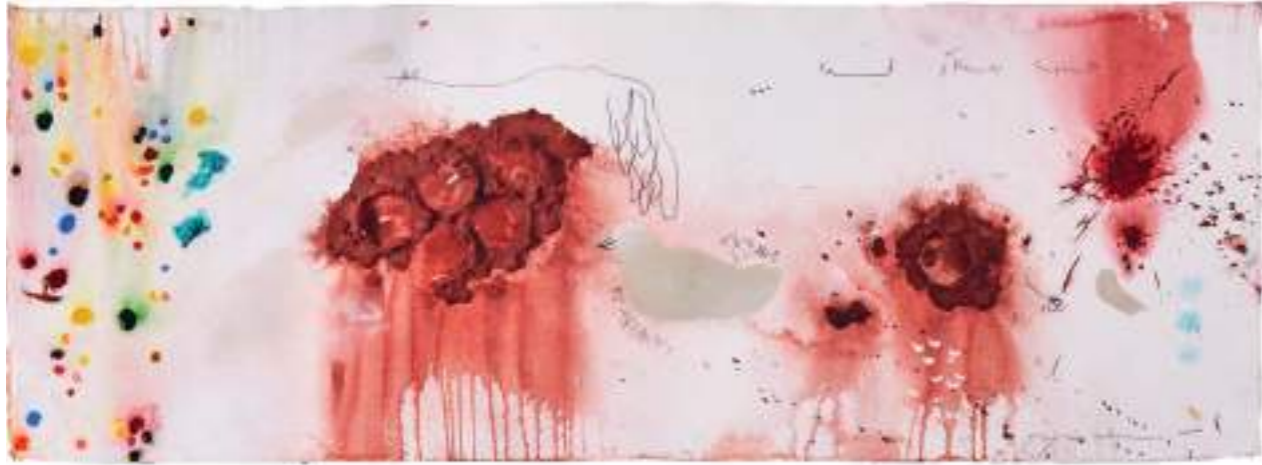
Cien Íkaros cayendo VII Técnica mixta sobre paper | 40 x 110 cm