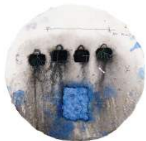
Reflexió Tècnica mixta sobre paper | Ø 35 cm