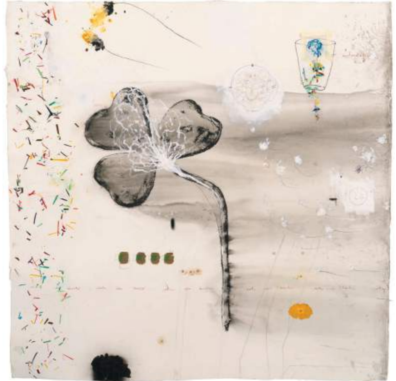
Ser contradictorio Técnica mixta sobre paper | 130 x 130 cm