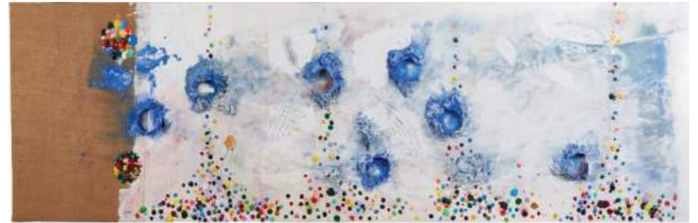
Queien i pujaven altres Íkars Tècnica mixta sobre fusta | 49 X 159 cm

Massana looks at us, through his work, with an open, clear and expectant look, diving in the depths, but also on the Surface, analyzing and expectant, welcoming and demanding.