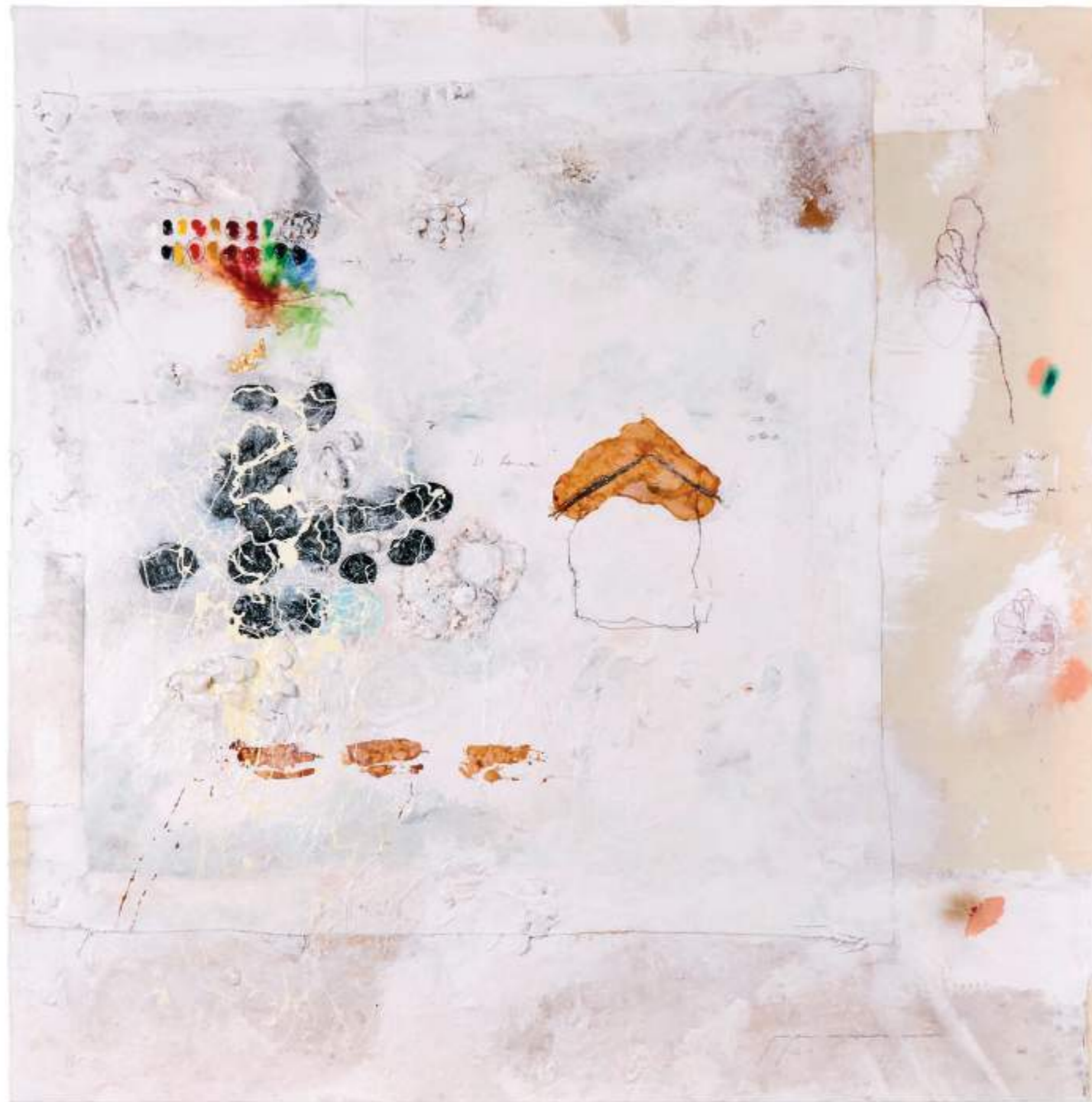
Hacerte un refugio con las flores que he pintado para tí Tècnica mixta sobre tela | 120 x 120 cm