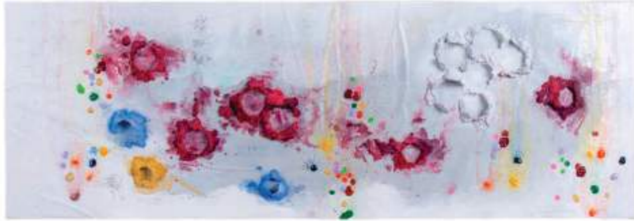
Cien Íkaros subiendo XI Tècnica mixta sobre tela | 41 x 122 cm

Massana ens mira, a través de la seva obra, amb una mirada oberta, clara i expectant; que busseja en les profunditats, però també arran; analitzadora i expectant; acollidora i exigent.