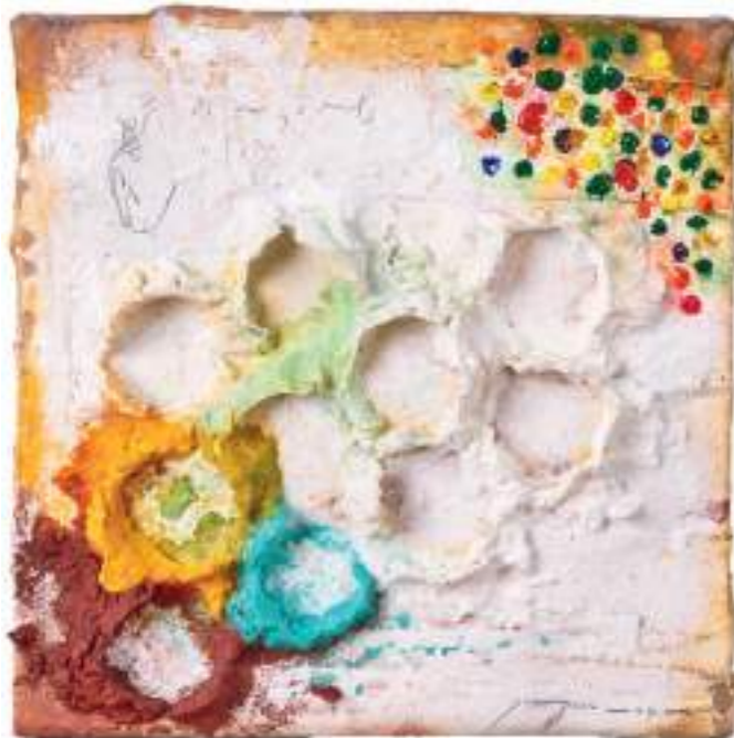
Diagonales Tècnica mixta sobre tela | 30 x 30 cm