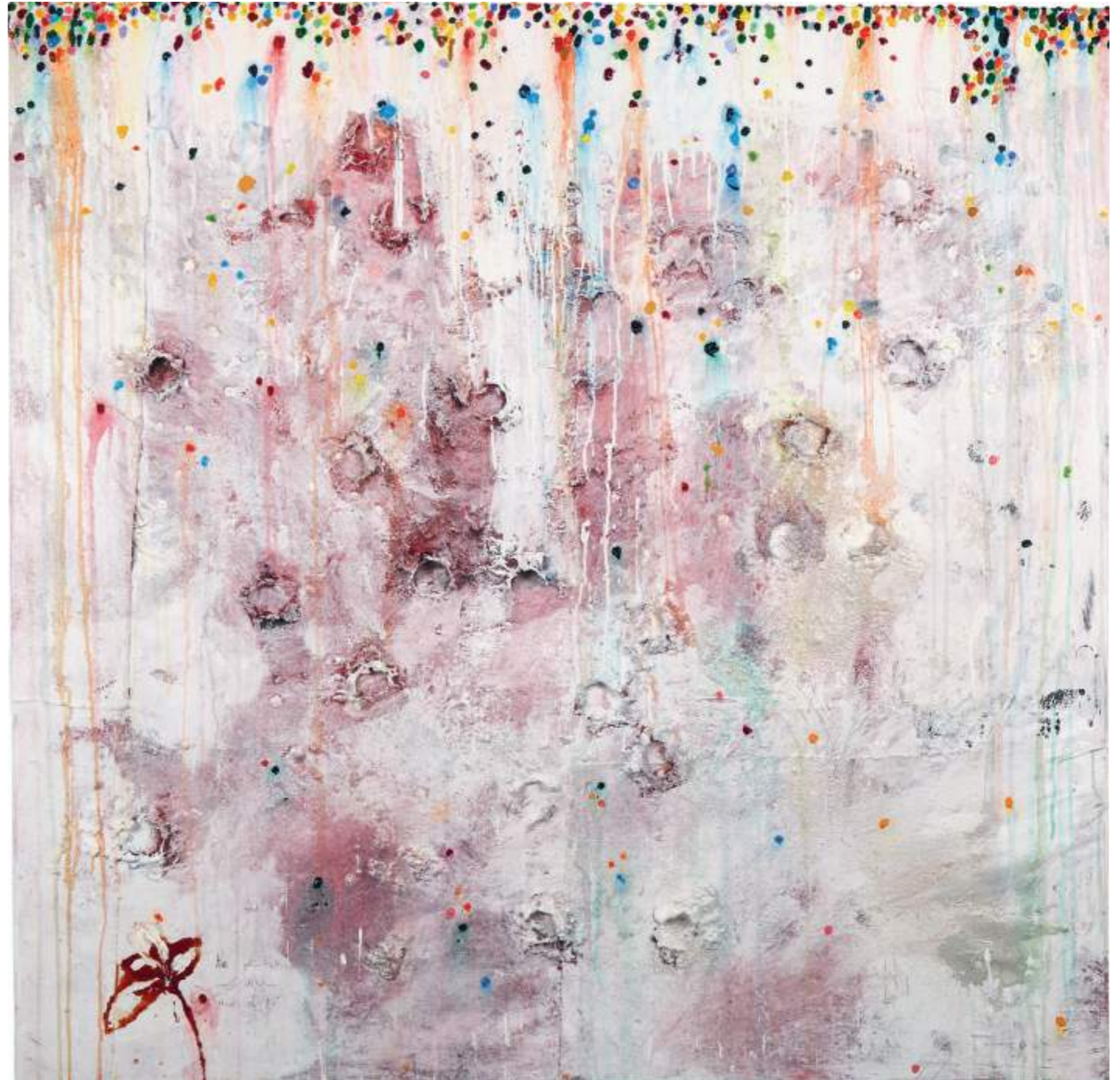
He plantat un lliliom per a tu Tècnica mixta sobre tela | 162 x 162 cm