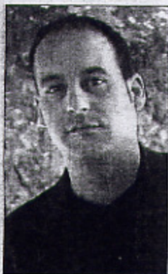
Joanpere Massana presentará en Madrid 'Un vaixell se'n va', un homenaje a Guinovart

Poco después de la muerte de Josep Guinovart, el creador de Ponts Joanpere Massana dedicó una obra al autor de Agramunt. La pieza, titulada Un vaixell se'n va , se podrá ver próximamente en la feria Art-Madrid 2008, un certamen que arranca mañana en la capital española y en la que Massana exhibirá algunas de sus obras de la serie El llibre de l'aigua .